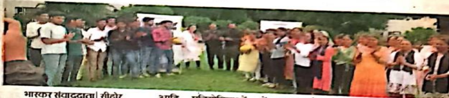
भारत संवाददाता | सीहोर

आर्यावर्त विश्वविद्यालय में शुक्रवार को खेल दिवस का आयोजन किया गया। इस अवसर पर विश्वविद्यालय में खेल प्रतियोगिता का आयोजन किया गया। इन प्रतियोगिताओं में विश्वविद्यालय के छात्र-छात्राओं द्वारा बैडमिंटन, वॉलीबॉल, शतरंज, कबड्डी एवं खो-खो