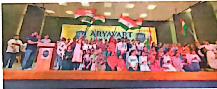
देशभक्ति की भावना पैदा करने शिविर शामिल छात्र और अध्यापक।