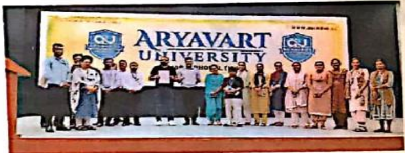
कार्यक्रम में मौजूद शिक्षक।

उन्होंने बताया कि इस प्रकार के इनक्यूबेशन सेंटर के माध्यम से स्थानीय लोगों को उधमिता से जोड़ा जाएगा। साथ ही विद्यार्थियों को निशुल्क प्रशिक्षण दिया जाएगा, ताकि उन्हें रोजगार से जोड़ा जा सके। इस प्रकार के केंद्र भारतीय ज्ञान परंपरा को आधुनिक समय के अनुरूप ढालने और उसे संस्थागत रूप देने के लिए विश्वविद्यालय में इनक्यूबेशन प्रकल्प की स्थापना की जा रही है। इस क्रम में विश्वविद्यालय द्वारा सजैविकों इंडिया प्राइवेट लिमिटेड भोपाल के