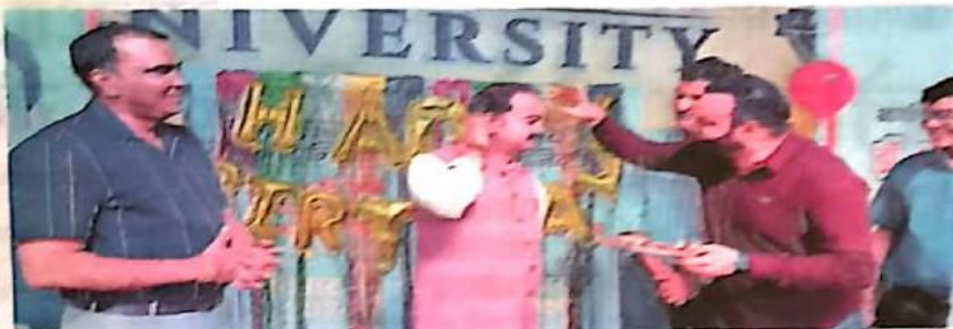
भास्कर संयादाला | संवाद

संस्थाओं की स्थापना का उद्देश्य न्यूनतम शुल्क में उत्कृष्ट शिक्षा उपलब्ध कराना है